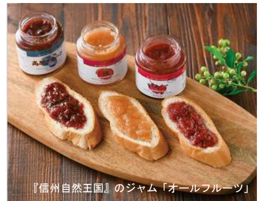
『信州自然王国』のジャム「オールフルーツ」

商品の一例としまして、砂糖を一切使用せず信州産のフルーツと果汁だけで煮込んだ『信州自然王国』のジャムや和歌山初・オークワ限定発売の『神戸エビアンコーヒー』、とろける味わいの『デリチユース』のチーズケーキ、『スープストックトーキョー』のスープなど当店にしかない商品をご提供します。その他、輸入チーズや、有機ワイン、ジビエのソーセージ、メッサ限定のお寿司の盛り合わせなどこだわり商品も取り揃えています。